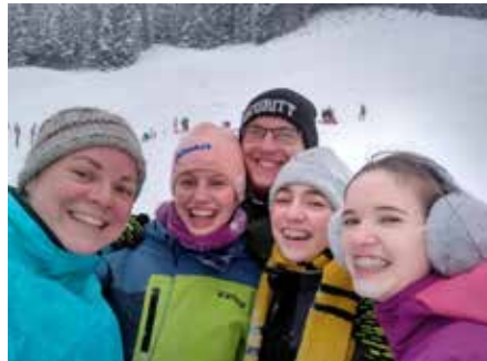
Auf der Kahle

Das, was mir am wichtigsten geworden ist in den vergangenen Jahren, sind jedoch die vielen Begegnungen. Gespräche mit Menschen, die an meiner Tür auftauchten und fragten: „Hast du mal kurz Zeit?“ - Ich habe immer versucht, mir die Zeit zu nehmen, und all diesen Großen