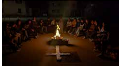
Durchwachte Osternacht der Jugendlichen

Mehr als 20 Jugendliche aus unserer Gemeinde und aus der Region trafen sich zur durchwachten Osternacht.