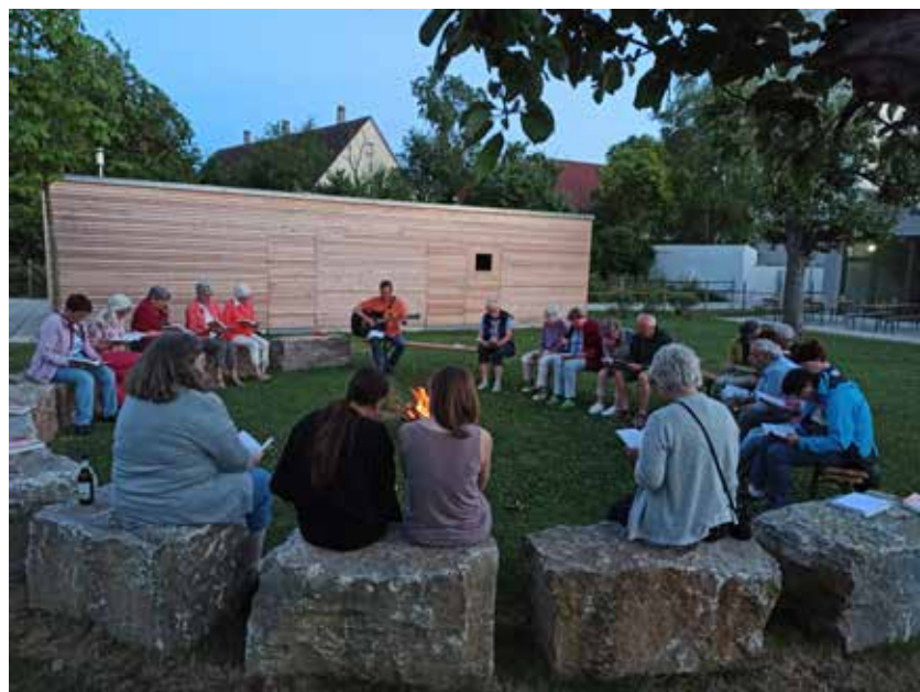
Impression vom Mitarbeiterdank 2023 mit Johannisfeuer

Die Mitglieder des Kirchenvorstands und das Hauptamtlichenteam