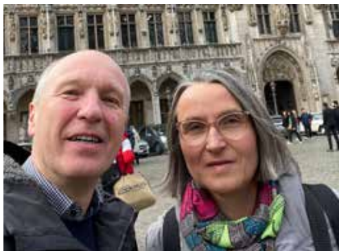
Mit meinem Ehemann auf dem Grand Place in Brüssel beim Vorstellungswochenende im Februar.